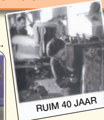
RUIM 40 JAAR