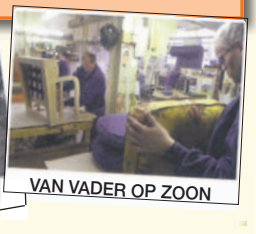
VAN VADER OP ZON