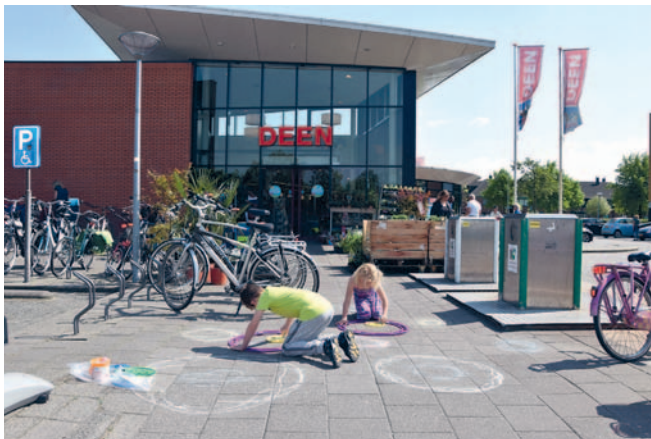
DEEN geeft SPIRALZ weg om mee te tekenen.

REGIO - DEEN Supermarkten maakt klanten blij met een cadeautje bij de kassa. Dit keer heeft DEEN zelf een actie bedacht om kinderen mee te laten tekenen. Voor kinderen is het heel goed om hun creatieve kant te ontwikkelen. Tot en met zaterdag 25 juni geeft DEEN speciaal ontworpen Spiralz weg, die kinderen kunnen gebruiken om verschillende soorten tekeningen mee te maken.